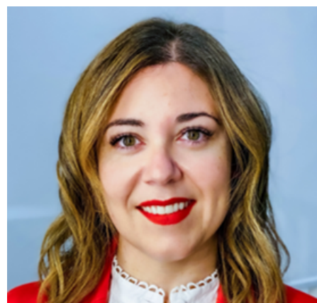
Presidenta WiN España

Women in Nuclear (WiN) España es una asociación apasionada por acercar el conocimiento de la energía nuclear a la sociedad y demostrar su papel crucial en el desarrollo sostenible. Nos dedicamos a la divulgación científica, con el objetivo de derribar mitos y generar conciencia sobre el valor de esta tecnología para un futuro seguro y limpio, y aspiramos a ser una voz de referencia en el mundo hispanohablante.